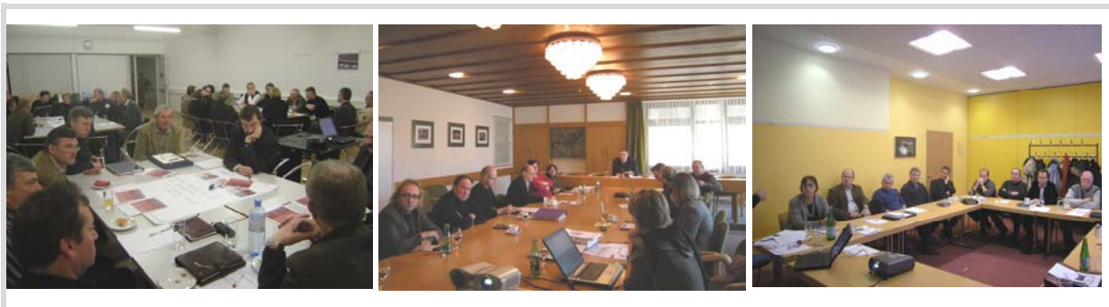
INKOBA Region Freistadt